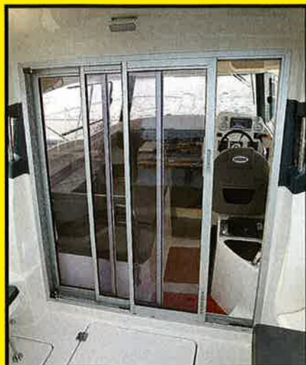
SKYVEDØR: Askeladden (bildet) og Antares har skyvedører i glass akterut. De er enkle og smidige å åpne og lukke, og gir i tillegg god sikt akterover. Høyden gjør at man ikke behøver å dukke når man skal ut på dekk.

hengsmotordrevet båt med styrhuset akterut et tyngdepunkt som ligger veldig langt bak. Det kan medføre at det kan være vanskelig å få båten opp i plan med en liten motorstyrke. På denne type båt bør man altså ikke velge det minste motoralternativet.