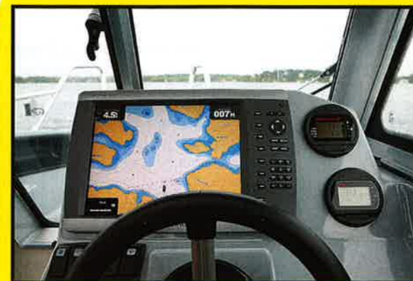
←PLASS: Selv om dashbordene er ganske smale, er det plass til en 12 tommer kartplotter i alle de tre testbåtene.