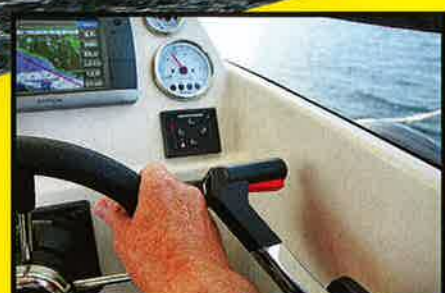
FEILMONTERT: På Askeladden P66 er gass-/gearspaken montert for nærme ratet slik at man slår knokene borti spaken.