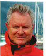
TEKST OG FOTO: LARS H. LINDÉN