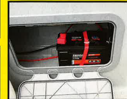
EGET ROM: Batteriet er lett tilgjengelig og i et eget rom på Buster XXL Cabin.