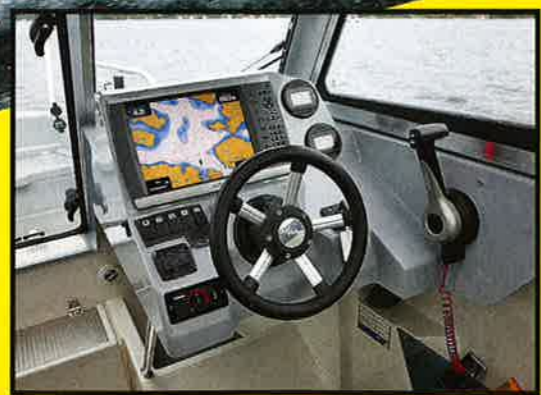
BEST: Det beste førermiljøet synes vi Buster XXL Cabin hadde. God fotplass, behagelig førerstol og instrumenter og knapper godt innenfor rekkevidde og synsvidde.