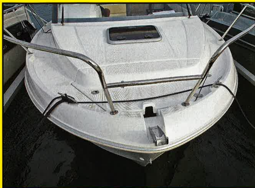
STENGT: Antares har denne konstruksjonen i stevnen med «stengt» pulpit og et skarpt ankerbeslag. Importøren hevder at det kommer en bedre løsning på båtene som skal leveres til det nordiske markedet.