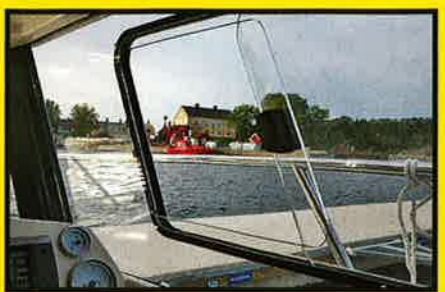
PRAKTISK: På Antares 680 er det smarte sideruter som ikke bare gir god ventilasjon, men som gjør at man i nødsfall kan vippe ut en fender eller slenge en trosse rundt en pullert om man er alene når man skal legge til.