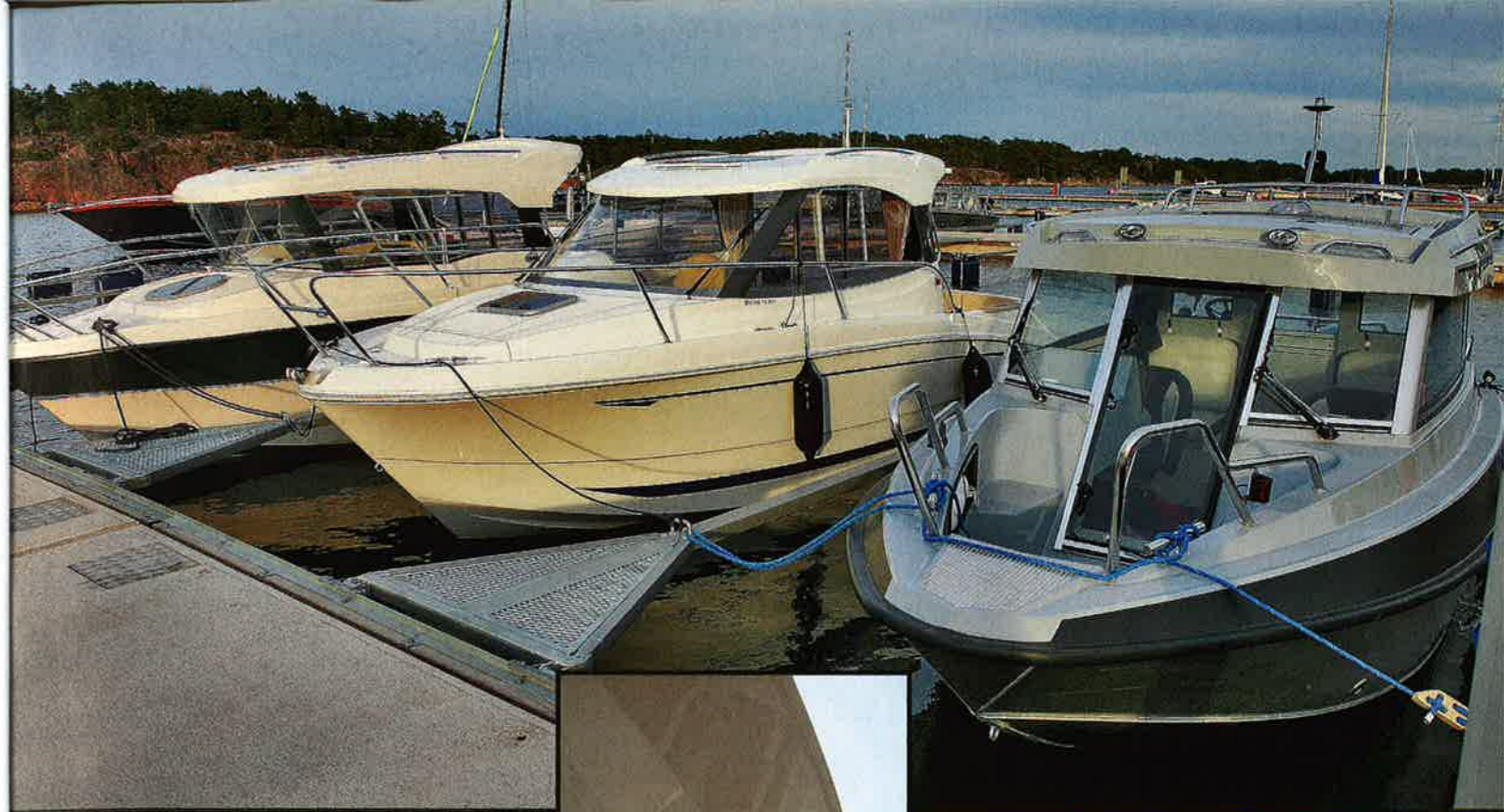
BESKYTTER: Askeladden (bildet) og Antares har forlengning av styrhuset slik at man har beskyttelse mot regn når man står ute.

På en båt med styrhus er den innvendige ståhøyde veldig viktig, og skal man ha ståhøyder på rundt 190 cm må man opp i båter på rundt 19-20 fot for å få et noenlunde greit forhold mellom styrhushøyden og båtskroget. I motsatt fall kan det se mer ut som et skilderhus, noe som er en ulempe både for tyngdepunkt og luftmotstand. De tre testbåtene