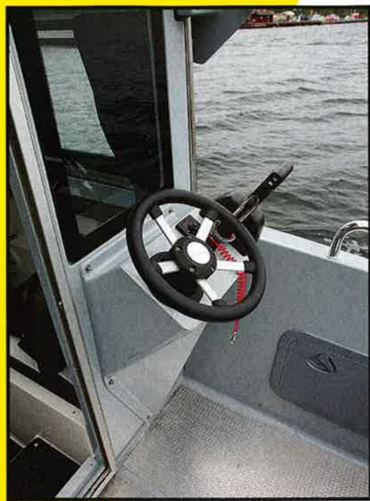
UTVENDIG: Både Askeladden P66 og Buster XXL Cabin (bildet) kan som ekstrautstyr utrustes med utvendig styreposisjon. Det letter håndteringen når man er alene ombord og skal legge til, eller om man arbeider med fiske på akterdekk.