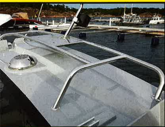
BØYLE: Buster XXL har denne bøyle på styrhuset. Her er det plass til diverse antenner og lys.