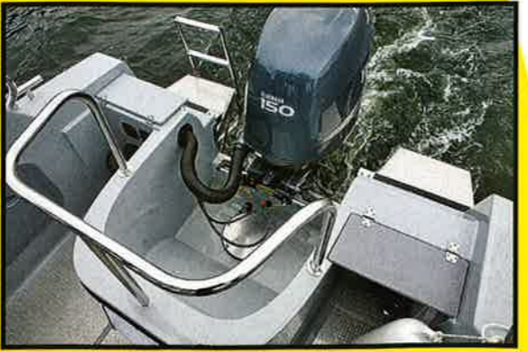
SIKKER: Godt sikret motorbrønn med solid griperekke og badeplattform på begge sider. Den ene med bade-/redningsleider.